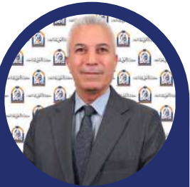
كلية النور الجامعة