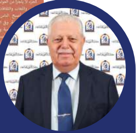
كلية النور الجامعة