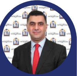
كلية النور الجامعة